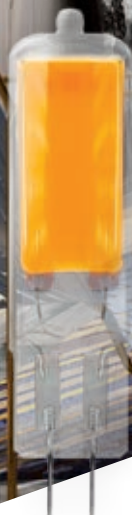
PIXYCOB 2W G4