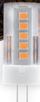
PIXYFULL 3W G4