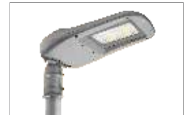
Fissaggio testapalo Pole Head Mounting