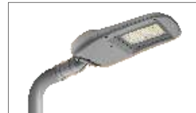
Fissaggio a frusta Pendant Mounting

Per palo \varnothing 60mm For a 60mm diameter pole